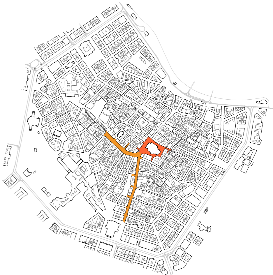
Phase 1 / 1st phase | Kärtnerstraße und Graben