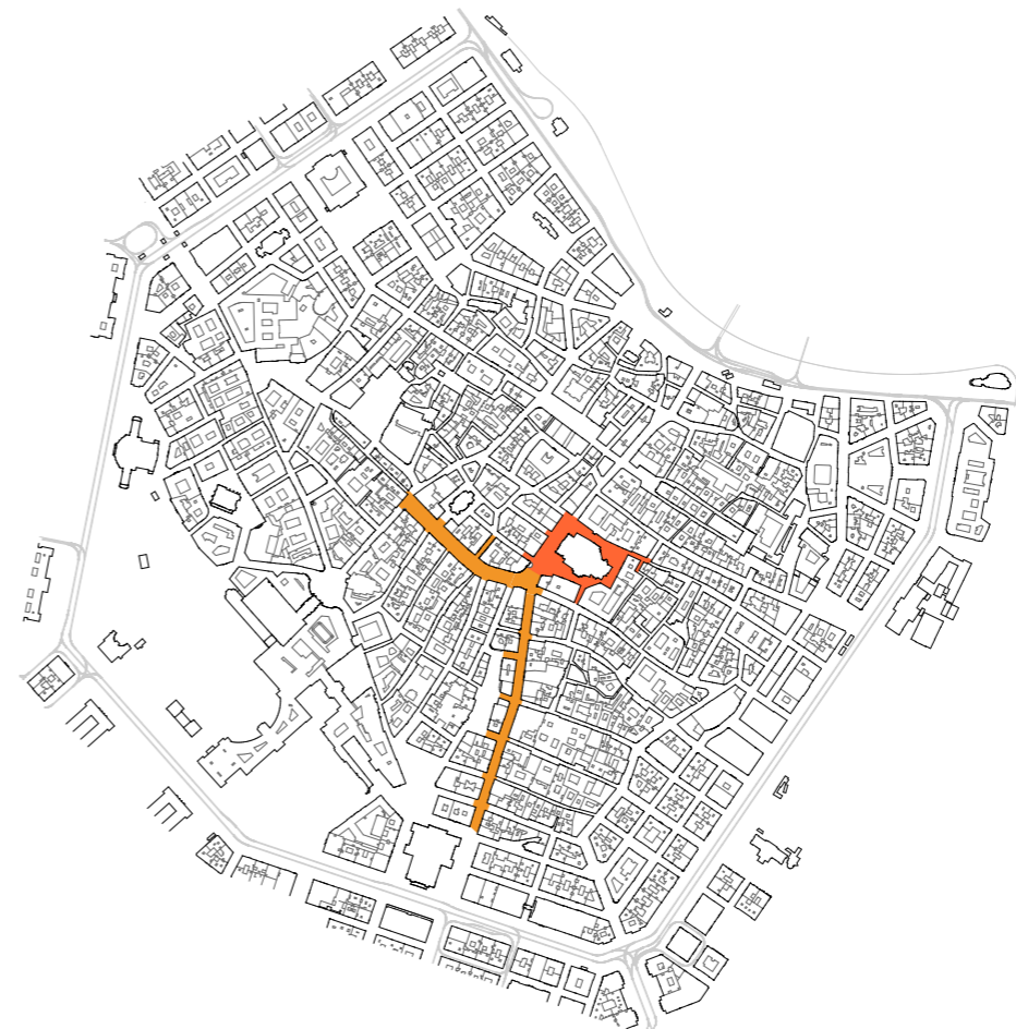
Phase 1 / 1st phase | Kärtnerstraße und Graben