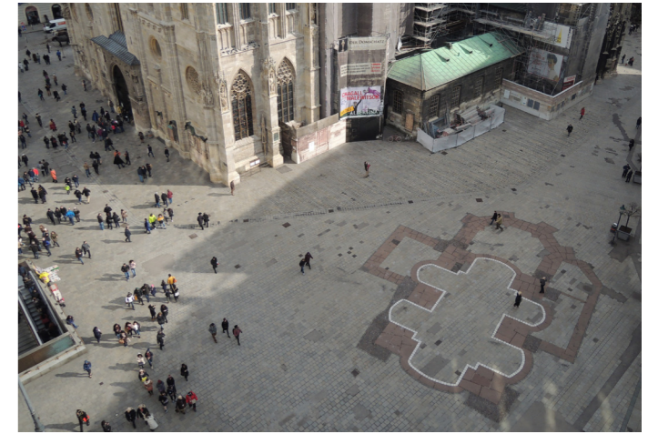
Vorher / Before